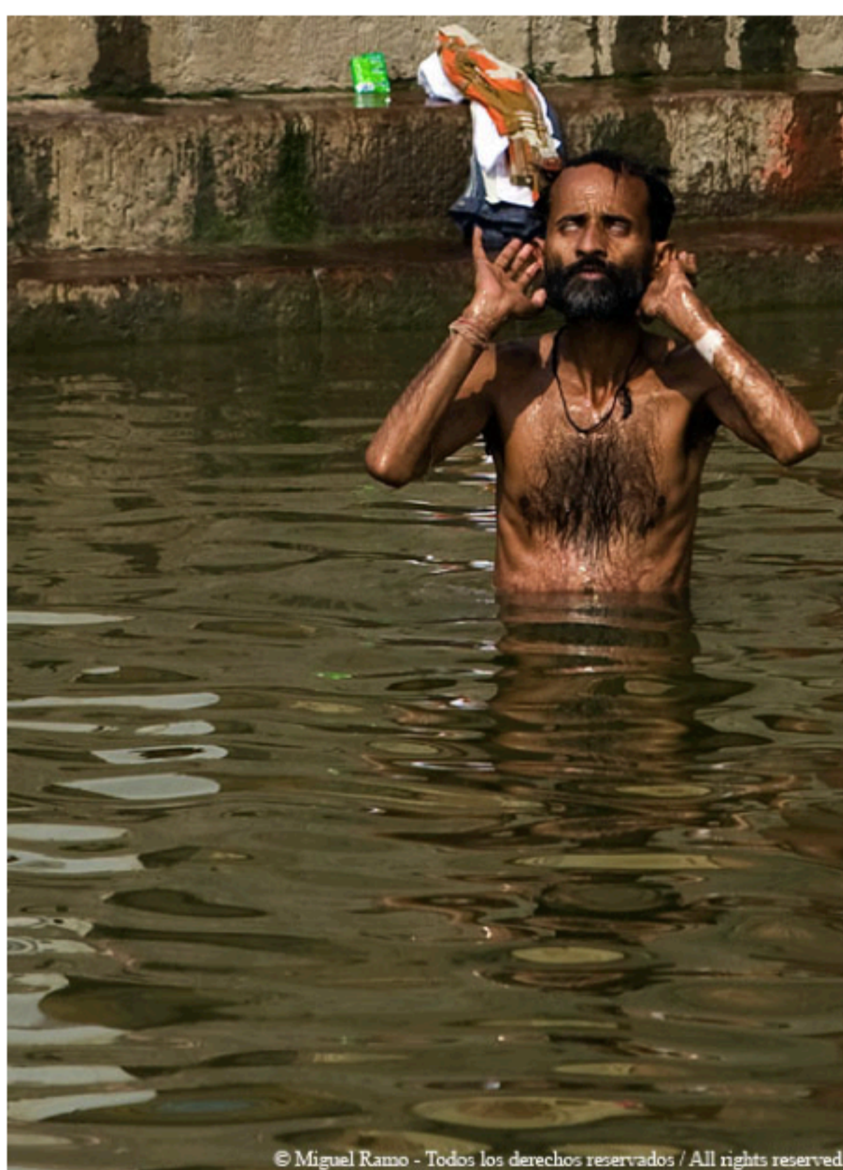
© Miguel Ramo - Todos los derechos reservados / All rights reserved.